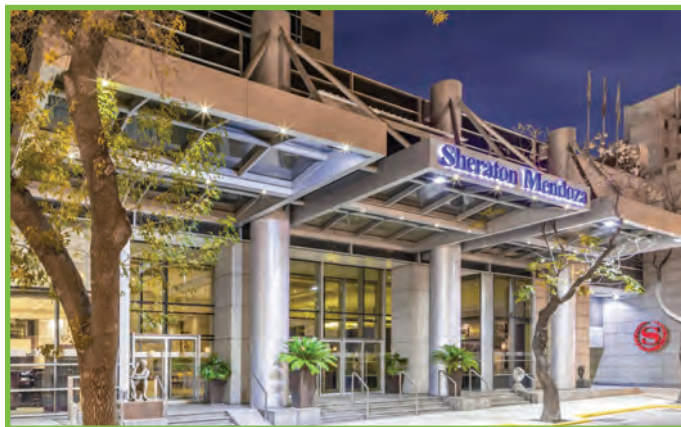
Sheraton Mendoza Hotel Primitivo de la Reta 989 Mendoza, Argentina, 5500

Faça suas reservas no Sheraton Mendoza Hotel até 7 de Outubro de 2019 a fim de obter a tarifa da conferência de USD 150 + VAT (21%) por noite. Reservas recebidas após essa data serão aceitas com base na tarifa de hospedagem vigente e de acordo com a disponibilidade de ocupação na ocasião. Esta tarifa é válida para 03 dias antes e 03 dias após o evento, e inclui café da manhã e internet.